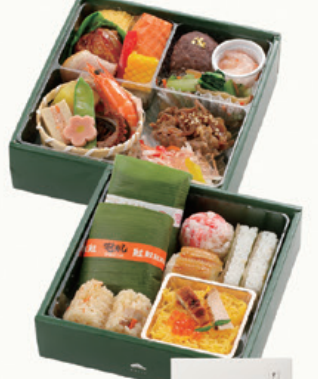
商品番号 718 松印 上段 16.6×16.8cm 下段 16.2×16.4cm 本体価格 2,200円 税込価格 2,376.00円