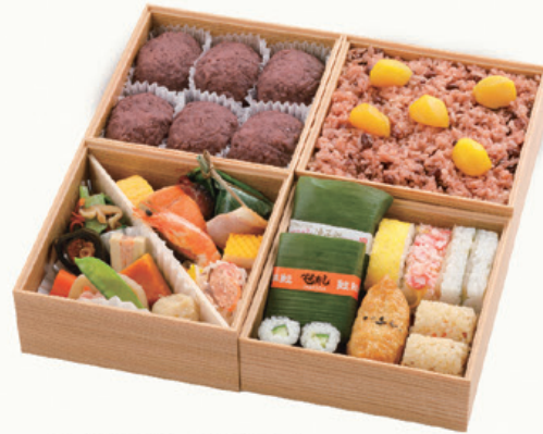
おめでた 中サイズ 15×15cm