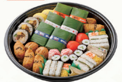
商品番号 709 ファミリー(大) 5人前 直径 37.5cm 寿司や巻き寿司など、10種類のお寿司で大満足。 親しいご友人やご家族のお集まりの席に最適です。 本体価格 3,000円 税込価格 3,240.00円 ※土日祝日のみ予約販売しております。