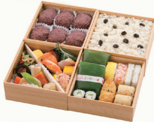
まごころ 中サイズ 15×15cm