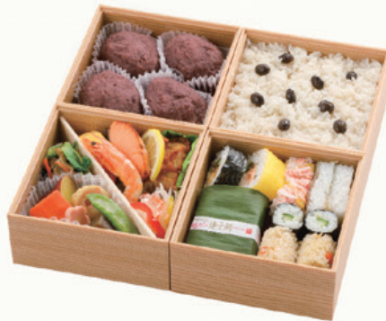
まごころ 小サイズ 13.7×13.7cm