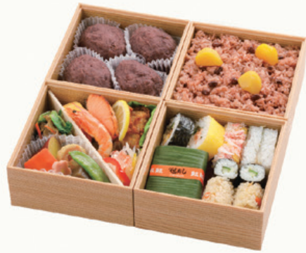
おめでた 小サイズ 13.7×13.7cm