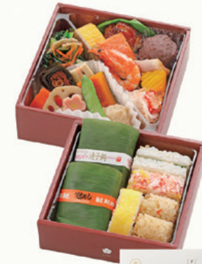
商品番号 717 花印 上段 15.2×15.4cm 下段 14.8×15.0cm 本体価格 1,700円 税込価格 1,836.00円