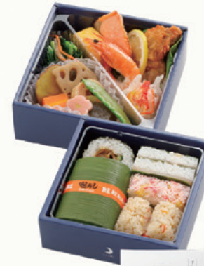
商品番号 716 月印 上段 13.8×14.2cm 下段 13.4×13.8cm 本体価格 1,200円 税込価格 1,296.00円